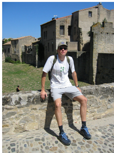
Un gros bidon, un p'tit bidon sur les remparts de Carcassonne